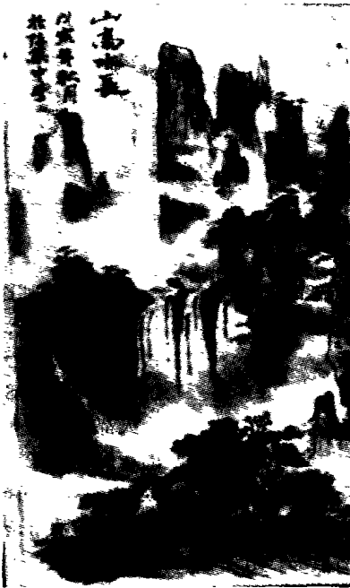
安徽省肥东县陈集中学/陈健作

底”、暗插的“间谍”或“一只眼睛”等,这些特殊身份的命名委屈了许多班干部。于是,我让学生自己选。同学们选出来之后,再征求本人同意,发表就职演说,让同学们明确班干部的职责、服务宗旨,并且采取学生监督制。班干部任期2个月,再重新选举,连任的班干部不得超过一学期,对连任的班干部“论功行赏”以资鼓励。