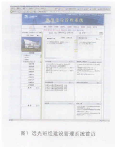
图1 远光班组建设管理系统首页